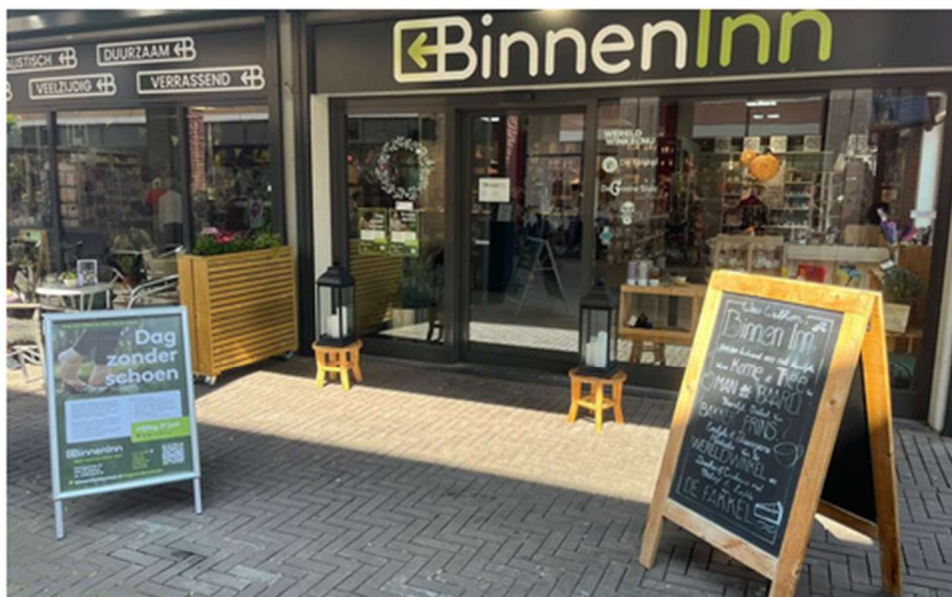
Op vrijdag 21 juni houdt BinnenInn de Dag zonder Schoen.

BinnenInn in Lelystad staat op vrijdag 21 juni in het teken van solidariteit en milieubewustzijn tijdens de 'Dag zonder Schoen'. Met een reeks activiteiten gericht op het creëren van bewustzijn rondom de armoede waarin miljoenen mensen leven zonder schoeisel.