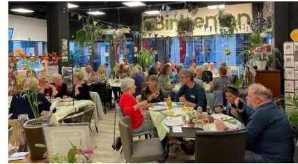
Ontmoet je maatje avond

De eerste Ontmoet je maatje avond van het jaar bood weer nieuwe ontmoetingen en hartverwarmende gesprekken. Samen met Humanitas en andere partners blijven we deze avonden organiseren – kleine stappen die soms grote betekenis hebben.