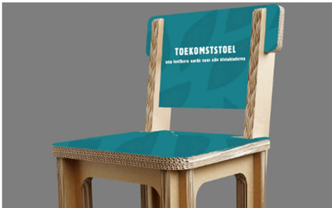
De Toekomststoel van Jan Terlouw.

Grootouders voor het Klimaat Lelystad zijn op de laatste vrijdag van de maand van 11.00 tot 13.00 uur aanwezig bij BinnenInn, Neringpassage 54, om samen met inwoners van Lelystad te reflecteren op de toekomst van onze planeet. De Toekomststoel van Jan Terlouw, een symbool voor dialoog en bezinning, staat hierbij centraal.