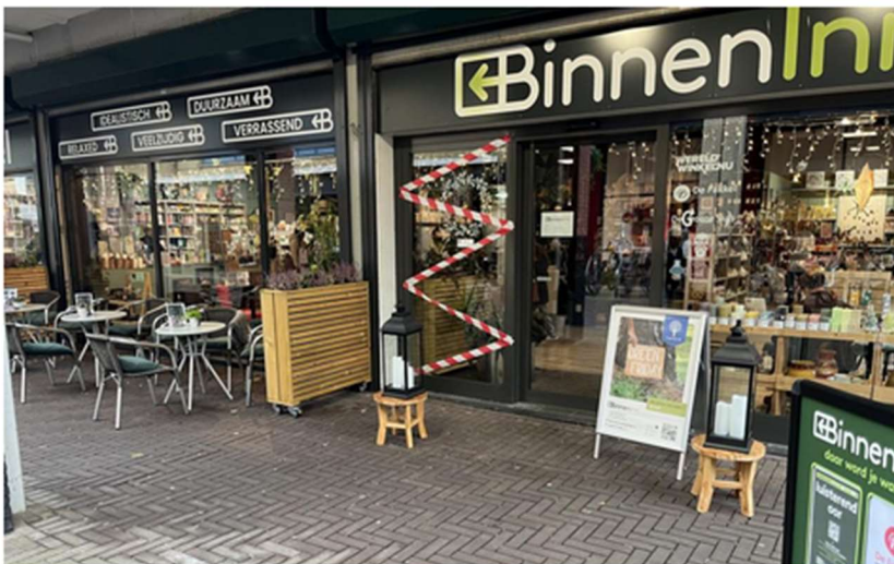
Zo'n 70-75 procent van de bezoekers heeft 10 procent extra betaald.

Egbert Voerman • 30 november 2024, 13:22 • Lelystad Deel dit artikel